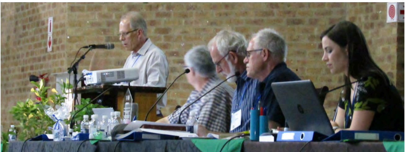
Dagbestuur Sinodale Diensraad tydens Sinodesitting 2024

Tydens die 2007 Sinodesitting word byna eenparig besluit om die naam van die Sinode te verander na Oostelike Sinode (met ander name soos Oosterlig Sinode en Môrester Sinode wat ook oorweeg is)